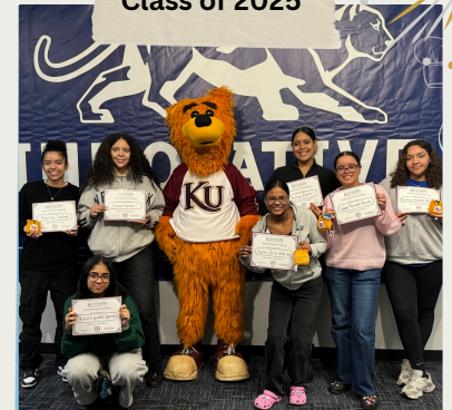
Destinatarias de matrícula completa de KU